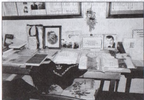
Куточок, присвячений місцевим провідникам ОУН

Рада музейного комплексу ставила перед собою мету зібрати матеріали не лише про село, церкву, школу, а й про вулиці, цікаві родини і особистості.