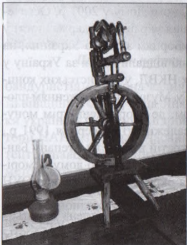
Прялка (ножна), лампа настінна