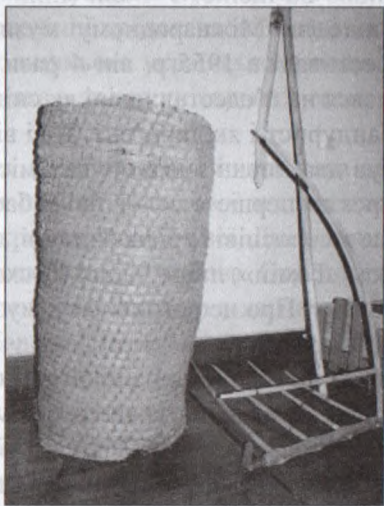
Солом'яний кіш для зберігання зерна, цін, грабки до коси

Після завершення терміну полону у Великобританії організував на початку 1949 р. мішаний, відтак – славнозвісний чоловічий хор «Гомін», який став репрезентативним хором Союзу українців у Великобританії. Був головним диригентом Ювілейного Пластового чоловічого хору (70-ті рр. минулого століття), про що красномовно розповідає книга «Пласт у Великобританії». Компакт-диски і аудіокасети «Співає Пласт» стали надбанням не тільки музею, а й пласто-