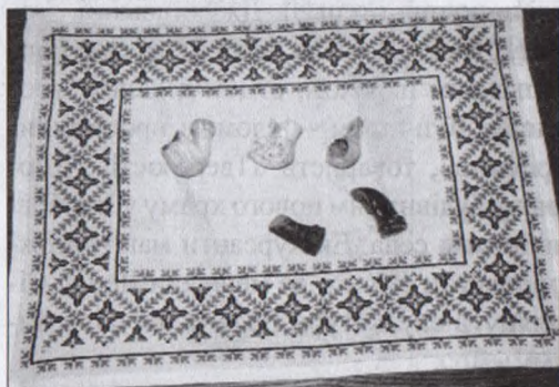
Козацькі люльки XVI-XVII ст.

двох ангелів висотою 0,6 м та розп'яття Ісуса Христа висотою 1,8 м – роботи польського скульптора Яна Пфістера), а також скульптура святої Марії-Магдалини (XVII ст.) невідомого автора.