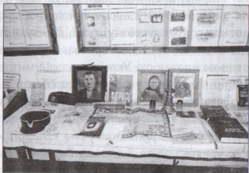
Фрагмент експозиції, присвяченої борцям за вою України - вербівчанам