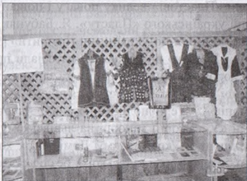
У музеї в школі

Велика підбірка матеріалів присвячена святкуванню 1000-ліття хрещення України-Руси в діаспорі і ролі Я. Бабуняка у ювілейних відзначеннях. Об'єднавши хори Великобританії навколо «Гомону», він створив 230-особовий «Хор Тисячоліття», а приєднавши до нього хори «Думка» з Америки, «Веснівку» з Канади, хор голландських козаків («Візантійський хор») з Нідерландів, zorganizував 430-особовий зведений хор і виступив у королівській залі Лондона у травні 1988 р. з величким концертом у день відкриття пам'ятника Володимирі Великому – хрестителю України-Русі. Із спогадів громадсько-культурного діяча Великобританії В. Луціва дізнаємося, наскільки це була важка праця для диригента: «Потрібно було володіти неабияким хистом і мати віру в свої сили, щоб створити такий хор-моноліт» [8, с. 151]. У музеї представлені відеоматеріали ювілейного концерту в королівській залі Лондона, а також ювілейного концерту з участю хорів з 8-ми країн із нагоди Тисячоліття у Римі, де Я. Бабуняк теж був головним диригентом. В альбомах розміщено понад 100 унікаль-