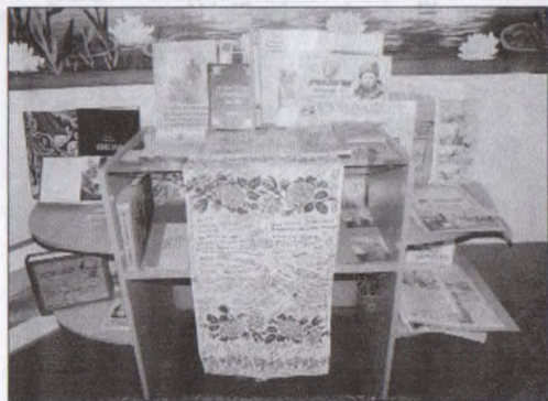
Куточок Вербівської шевченкіани. Рушник міжнародного шевченківського свята на Тернопільщині