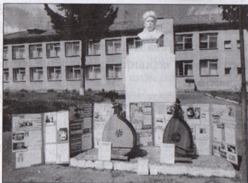
Рімінські бандури. Мандрівна експозиція

віртуоза, поета, доктора медицини Зиновія Штокалка у Тернопільському обласному та Бережанському краєзнавчих музеях (2011 р.), у козацькій світлиці Тернопільського замку з нагоди Шевченківського свята (2011 р.). Про ці виставки писали обласні, районні, всеукраїнські газети, вони згадувались у передачах обласного й українського радіо.