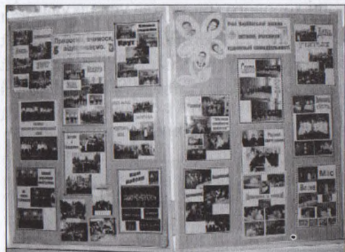
У сучасній школі

них фотографій з ювілейних святкувань, численні відгуки у пресі, література про ці події з дарчими підписами, а також Подяка Я. Бабуняку від глави УГКЦ кардинала М. Любачівського, аудіокасети із записом Літургії І. Злотоустого у виконанні ювілейного хору Тисячоліття. Ця експозиція доповнена відео- і фотоматеріалами про святкування у Вербові 1020-ти і 1025-ліття хрещення. Чимало матеріалів є про організацію «Пласт», його ювілейні концерти, головним диригентом яких був теж Я. Бабуняк, до 50-річчя українського «Пласту», і його 25-річчя у Великій Британії. Платівка із записом ювілейного пластового хору розійшлася по всіх пластових станицях світу. До 100-річчя українського «Пласту» платівки були переписані на диски. Як і книга «Пласт у Великій Британії», з настанням незалежності диски розіслані по всіх пластових станицях України. Із експонованої книги «Пласт у Великій Британії» дізнаємося: «Я. Бабуняк на пластовому таборі створив всього за три тижні ювілейний 100-особовий хор, концерти якого викликали велике захоплення у глядачів і принесли «Пластові» велику повагу і пошану, а Бабуняку – титул «Добродій українського «Пласту». Я. Бабуняк навчив співати навіть тих, які ще не вміли по-українськи говорити» [9, с. 99].