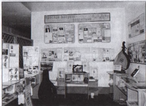
У музеї ім. родини Бабуняків

пісні, хорового та бандурного мистецтва. При рімінському хорі «Бурлака», до якого відбір був строгіший, ніж до консерваторії, працювала ще й танцювальна група. Я. Бабуняк, як один із організаторів хору, його соліст і керівник, прагнув ще й створити хоча б малу капелу бандуристів.