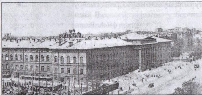
Київ – Університет і Володимирський собор