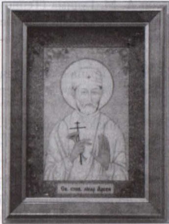
Ікона Святий сповідник лікар Арсен