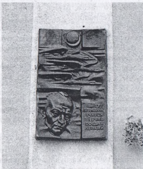
Мал. 2. Барельєфний пам'ятний знак. К. Сікорський. 1992.