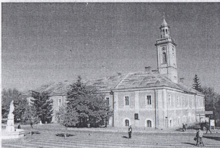
Мал. 1. Бережани. Ратуша. Тут розгорнуто експозицію музею Б. Лепкого.

музею відкрито пам'ятник письменникові (скульптор І. Сонсядло, металізатор М. Самарик, архітектори Б. Білоус, А. Пилипець) (мал. 3).