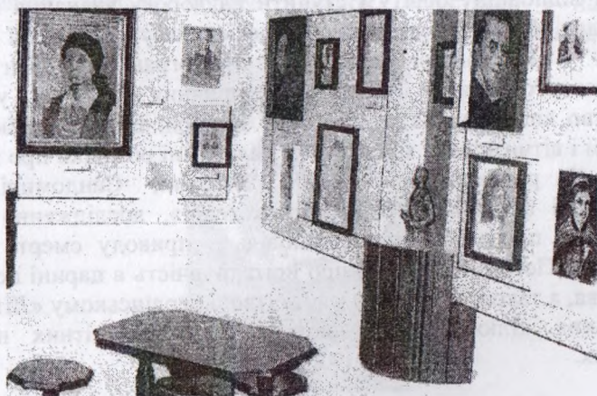
Мал. 5. Фрагмент експозиції п'ятої зали музею.

Експозицію п'ятої зали визначають слова Б. Лепкого: «Коли б я не був письменником, тоді хотів би бути лише малярем». Перед відвідувачами розкривається друга мистецька іпостась великого українця. У музеї виставлено 56 малярських робіт Б. Лепкого. Привертає увагу насамперед портрет дружини в українському строї (мал. 5), портрет о. Миколи Лепкого (1923), автопортрет (1932), портрети рідних.