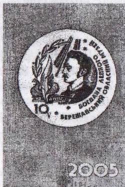
Мал. 6. Ювілейний календарик до десятиріччя музею Б. Лепкого. Художник Я. Омелян. 2005.

Працівники музею ведуть активну науково-дослідну, видавничу, культурно-освітню і популяризаторську діяльність. У їхньому доробку 12 книжок (поезії, спогади, листи Б. Лепкого, бібліографічні покажчики, збірники матеріалів наукових конференцій), 6 календариків (мал. 6), портрет, значок, 150 статей у наукових збірниках, журналах, газетах, 7 чисел альманаху «Жайвір» тощо.