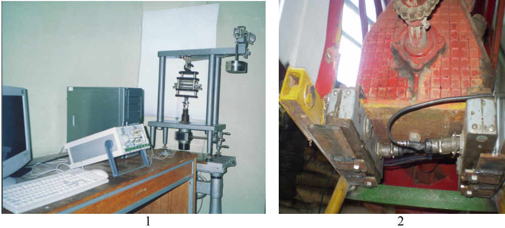
Рисунок 2. Тестування системи: 1 – у лабораторних умовах; 2 – в натурних умовах

Комплексні дослідження можуть проводитися для зернозбиральних комбайнів, бурякозбиральних комплексів, тракторів, культиваторів, сівалок, плугів, машин для хімічного захисту у рослинництві та іншої мобільної і стаціонарної сільськогосподарської техніки, а також для автомобільного та залізничного транспорту при постановці на виробництво нової, вдосконаленні або модернізації існуючої техніки з видачею енергетичних характеристик машин та рекомендацій з прогнозування їх довговічності та ресурсу роботи у відповідності з сучасними вимогами до висновків державних випробувальних станцій.