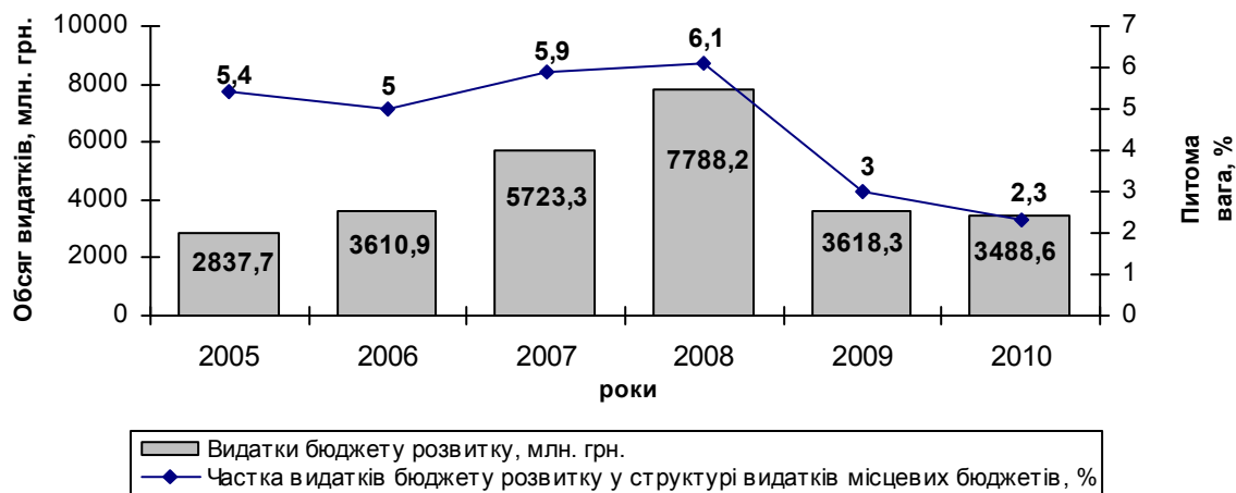
Рис. 3. Динаміка витраток бюджету розвитку місцевих бюджетів України у 2005–2010 рр. [4, с. 111]

Найбільше витраток розвитку здійснювалося із бюджету Києва: у 2010 р. вони склали 620,3 млн. грн., або 17,8 % витраток бюджету розвитку всіх місцевих бюджетів (у 2008 р. – 28,0 %). Також значно більшими щодо решти регіонів є витратки розвитку Запорізької (343,7 млн. грн.) та Одеської (280,7 млн. грн.) областей. Однак порівняно із показниками 2009 р. фактичні обсяги витраток розвитку місцевих бюджетів зменшилися у 15-ти регіонах України [4, с. 112].