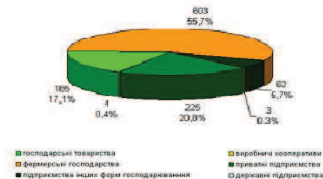
Рис.2. Сільськогосподарські підприємства області