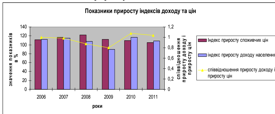
Рис.1. Оцінка приросту індексів доходу та цін в динаміці

Оскільки інфляція впливає на приріст споживчих цін, в процесі дослідження було визначено індекси приросту доходів населення та індекси приросту споживчих цін та співвідношення їх темпів приросту.