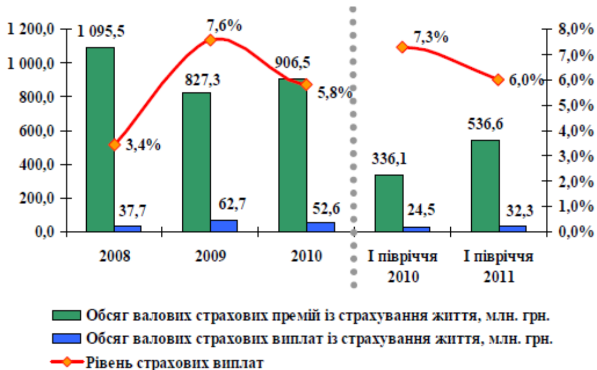
Рис. 1. Динаміка страхових премій та страхових виплат із страхування життя за 2008-2010 рр., I півріччя 2011 р. (млн. грн.)

Обсяги надходження валових страхових платежів та валових страхових виплат за 2008-2010 рр. та I півріччя 2011 р зображено на рис.1