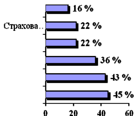
Рис. 1. Види страхування, що цікавлять громадян

Зараз страховики пропонують різні програми страхування, тому респондентам було задане питання: "Які програми страхування життя зацікавили б Вас і Вашу родину?" На це питання можна було дати кілька варіантів відповідей. Різновиди страхування життя, що зацікавили респондентів, зазначені на рисунку 1 .