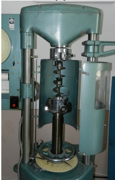
Рис. 2. Загальний вигляд машини на кручення КМ-50-1 з дослідними зразками секцій робочих органів

З їх аналізу можна встановити, що для окремих секцій без шарнірного зв'язку (графіки 1,2) функціональна залежність T = f(\varphi) має чітко виражений лінійний характер. Причому для вищенаведених конструктивних параметрів гвинтових секцій подальше зростання величини крутного моменту призводило до появи залишкових деформацій, що недопустимо.